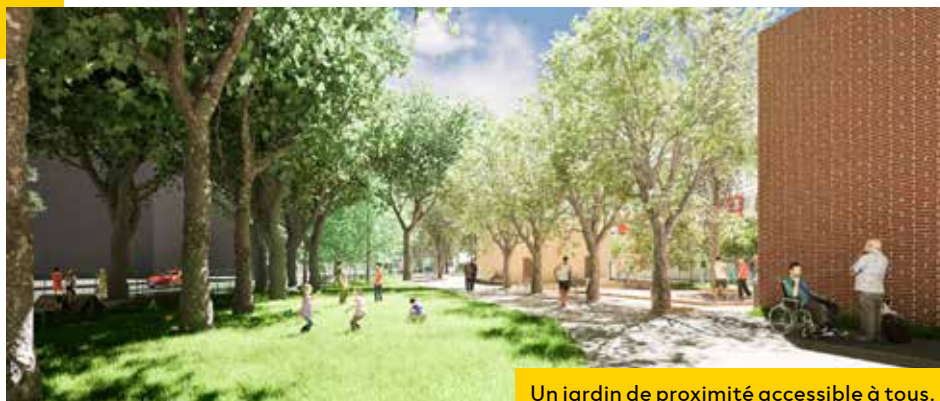
Un jardin de proximité accessible à tous.

Visuel d'ambiance non contractuel, interprété au stade des études en cours.