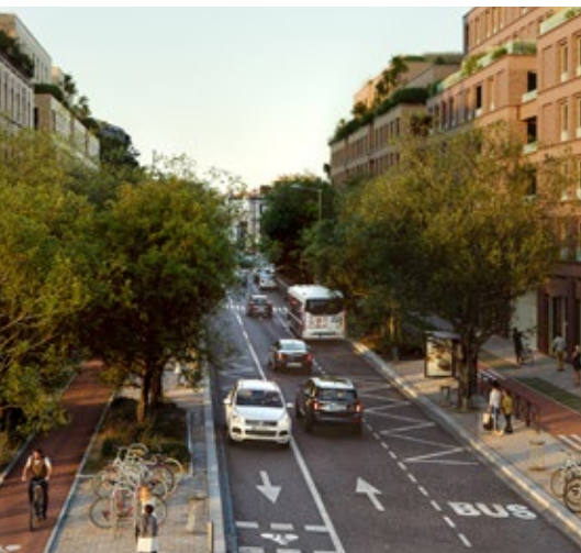
© KDSL - Architectes : Cros-Leclercq & APA, Hardel Le Bihan, 2PM A, Atelier RITA.

Nous faisons le maximum pour mutualiser les chantiers et minimiser les nuisances. Nous vous remercions pour votre compréhension.